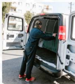
Proveedor de mercancías

Comerciante que trasladará mercancías de su local al domicilio de su cliente utilizando tramo federal, con un medio de transporte propio, esto es, no contrata los servicios de un transportista